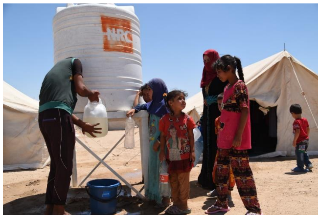
Flyktningshjelpen arbeider for å gi familiene som har klart å unnsnippe de intense kampene i Irak med rent drikkevann, matpakker og grunnleggende hygieneartikler i flyktingleiren Amariyat Al Fallujah.

Flyktningshjelpen er Norge største humanitære organisasjon med over 5000 ansatte i 30 land. Vi er en uavhengig, privat stiftelse med ett mandat: Å fremme og beskytte rettighetene til mennesker på flukt.