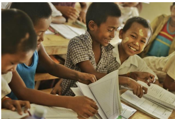
Landsbyen Pan Hpe Chaung i Myanmar fikk i år ny barneskole med nye møbler og skolemateriell.