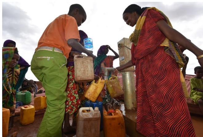
Kadra og innbyggere i landsbyen Halobiyo henter vann fra vannpumpen.